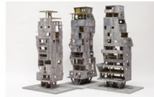
Lorenz Estermann, Metropolis Towers, 2011, Sperrholz / Pappe / Wasserfarbe, Höhe ca. 110 cm

Teilnahme an internationalen Kunstmesen: CIGE Beijing 07, ART Cologne, Viennafair, Art Moskau, Photo Miami, Maco Mexico 07, PULS New York 08, NEXT Chicago 08, SCOPE Basel 08, ShContemporary 08, KIAF Seoul 08, ART HK 09, Artefiera Bologna 09, Art Paris 09, Puls Miami 09, Pulse New York 2010, Art Cologne 2010.