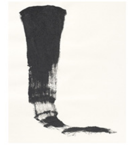
Daniel Lergon, Ohne Titel, 2010, Metallpigment auf Papier, 60x42 cm

ZEITKUNSTGALERIE KITZBÜHEL Hammerschmiedstraße 5, A-6370 Kitzbühel, Tel./Fax: 0043/5356/64805 galerie.zeitkunst@aon.at , www.zeitkunstgalerie.at