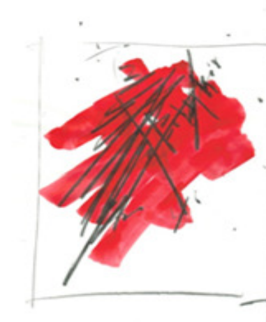
Imi Knoebel, Ohne Titel, 1972-74, Aquarell, Bleistift auf Papier, 29,7x21 cm