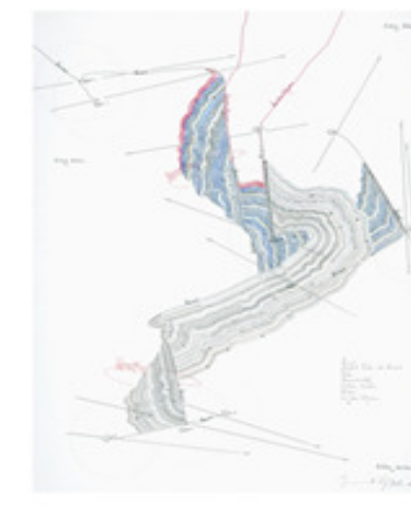
Jorinde Voigt, Horizont, 2011, Tinte, Ölkreide, Bleistift auf Papier, 61x46 cm